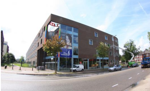
Vondellaan 174, 3521 GH, Utrecht