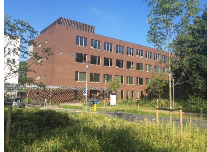
Maatweg 3, 38138TZ, Amersfoort